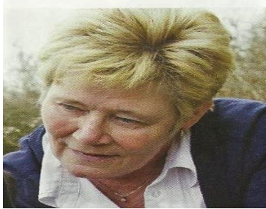
Hvil i fred

Hvor vil vi savne dig kære ven, tænker på dig med glæde og taknemlighed.